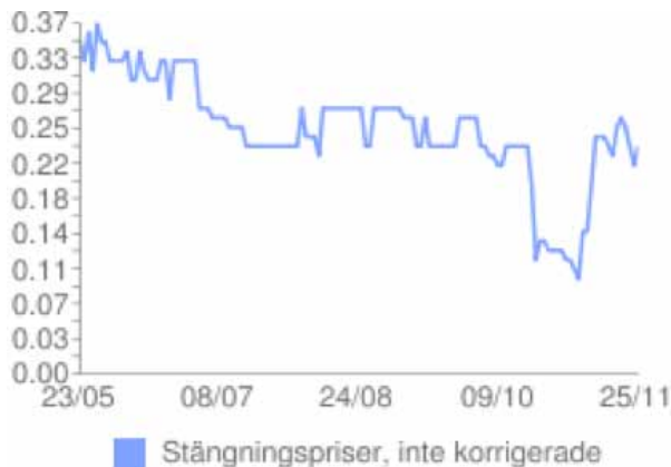
Aktiekurs 23 maj 2011 – 25 nov 2011